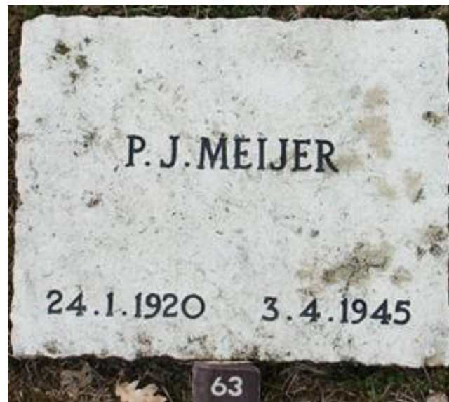
Piet Meijer is bijgezet op het Ereveld in Loenen.