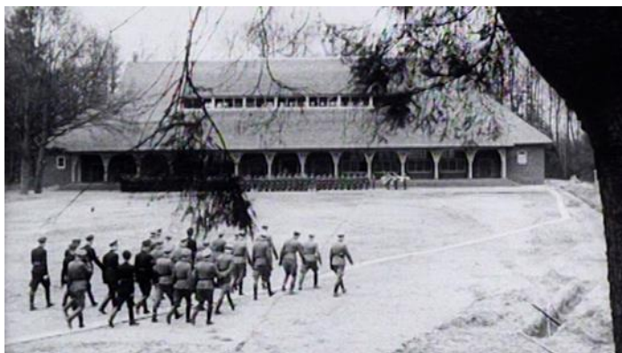
Opening SS Sporthal

Op 3 september 1942 werden in totaal 139 Joodse mannen (waaronder nogal wat gemengd-gehuwden) onder begeleiding van de SS naar villa “Irene” in Ellecom gebracht. De 139 Joodse gevangenen in villa “Irene” werden gebruikt voor de aanleg van een sportcomplex. Ze moesten in moordend tempo werken aan het grondwerk voor de aanleg van een SS-sportcomplex: een turnhal, 2 exercitieplaatsen, een sportveld en een atletiekbaan. Dit alles onder voortdurend geransel van de Nederlandse SS’ers, die met knuppels en karwatsen te keer gingen.