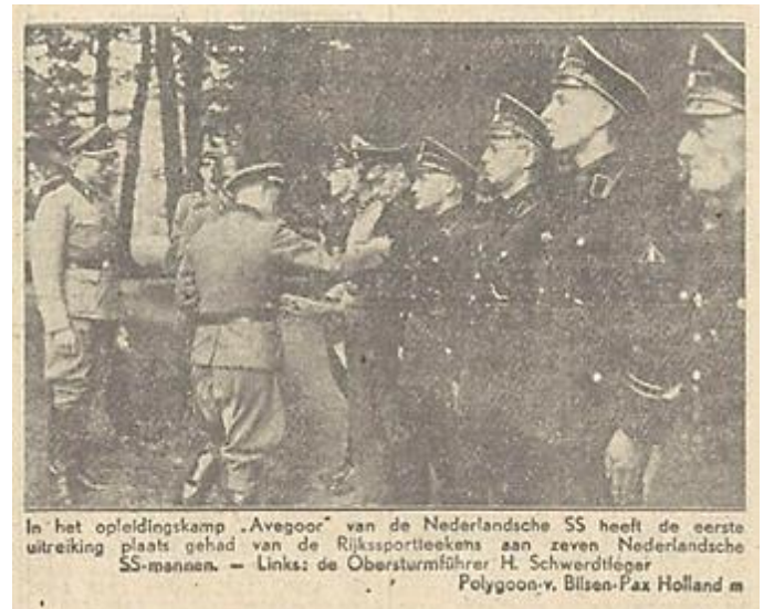
Provinciale Geldersche courant 12-8-1942

Om informatie op het landgoed over de oorlogsperiode te geven is een luisterkei met informatiebord aan het begin van de oprijlaan geplaatst.