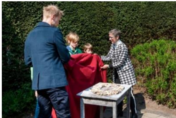
Onthulling in 2019

Dit monument is 14 april 2019 onthuld. Er is ook een boekje gemaakt: ‘Joods Monument Ellecom, 3 september 1942, 6 september 1998, 14 april 2019’.